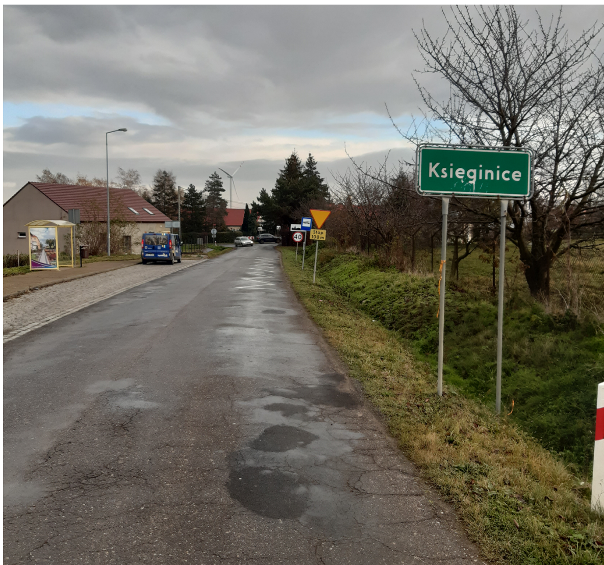
Księginice SAD (obok nr 1) - kierunek Koskowiec.