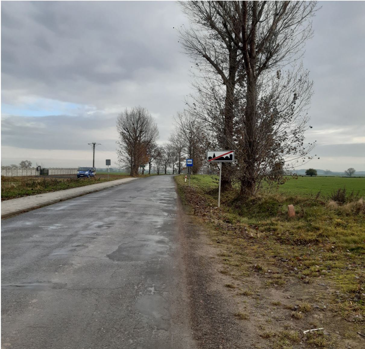
Id: 94E66063-1DB8-400A-AE79-0C1101C9BA36. Podpisany