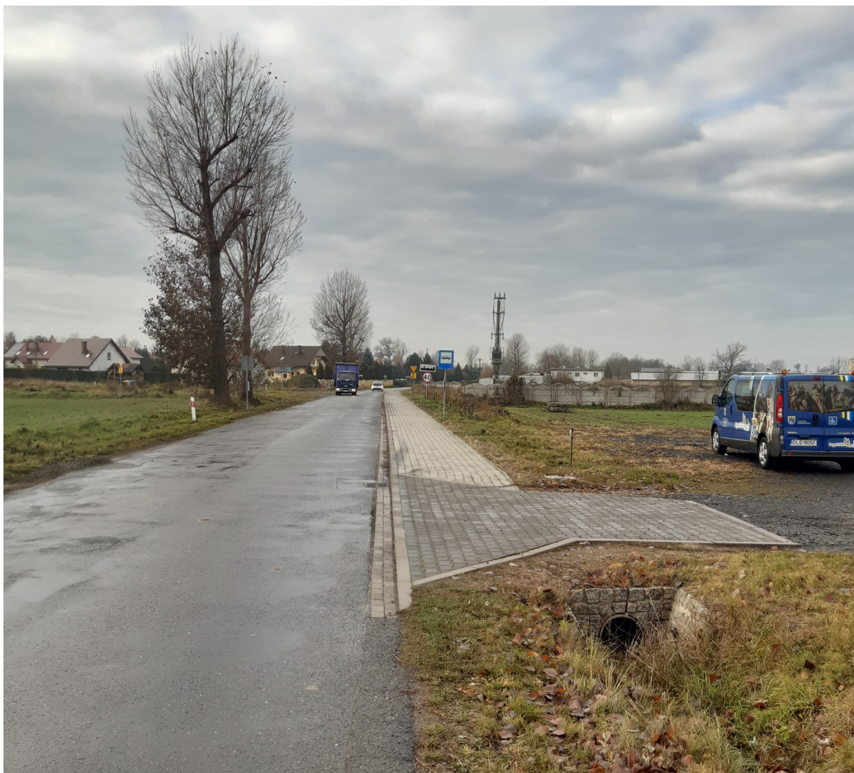
Koskowice Cmentarz - kierunek Legnica.